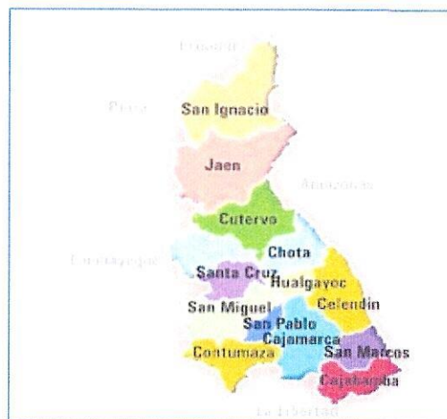
Mapa del Departamento de