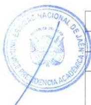
TABLA DE CALIFICACIÓN PARA NOMBRAMIENTO DE DOCENTES DE LA UNIVERSIDAD NACIONAL DE JAÉN - 2018.

4.4 El Jurado Calificador obtiene el resultado final aplicando la siguiente tabla: