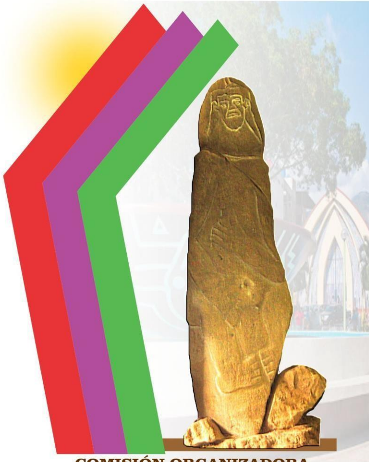
COMISIÓN ORGANIZADORA JAÉN HISTORIA Y PERSPECTIVAS DE DESARROLLO