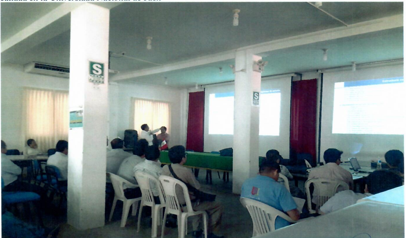
Fig. 4 Registro fotográfico del Taller: “Herramientas Curriculares para la Formación profesional de calidad en la Universidad Nacional de Jaén”